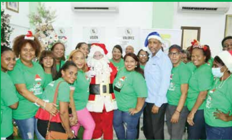
COOPMANOGUAYABO recibió la Navidad con música, abrazos, sonrisas y esperanzas.

La primera cooperativa del país pidió brindar una sonrisa, un abrazo para todos los seres queridos; parejas, hijos, amigos, familiares