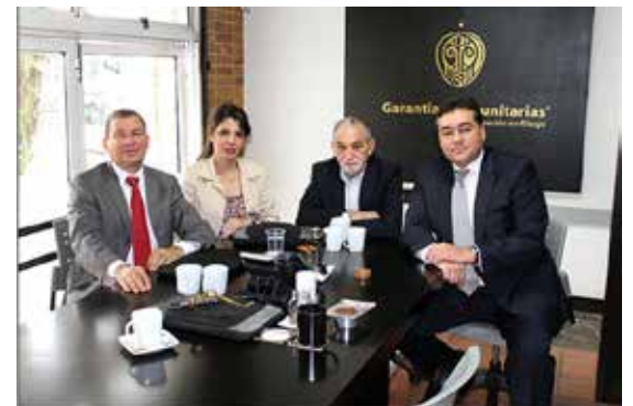
Una delegación de Cooperativas de las Américas realizó una visita a Garantías Comunitarias en su sede central en la ciudad de Medellín, Colombia.

En Garantías Comunitarias la innovación es un ingrediente clave, puesto que su gran componente tecnológico está acompañado de su robusto portafolio, que se basa en las formas de trabajo de Basilea y La Autoridad Bancaria Europea (EBA), algo que en definitiva ha llevado a esta compañía a convertirse en un importante jugador tecnológico de riesgo en Colombia y otros países del mundo.