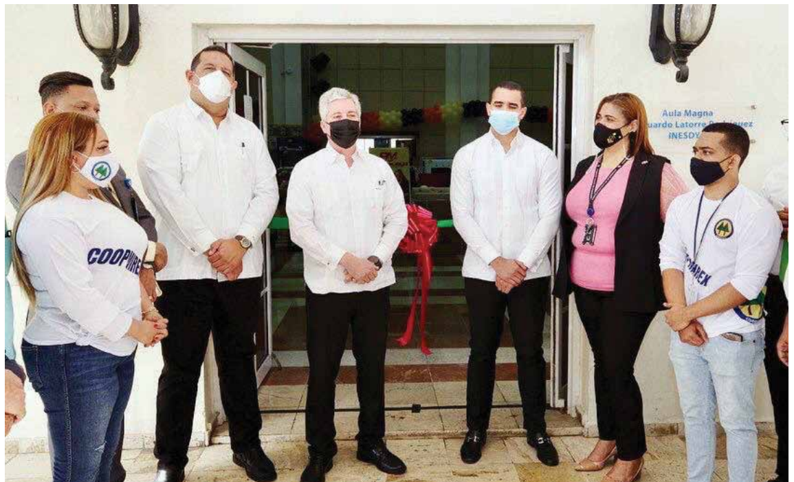
La III Feria Anual de COOPMIREX se desarrolló en el salón Eduardo Latorre del Ministerio de Relaciones Exteriores.

La gerente general de COOPMIREX indicó que la feria tiene como propósito fundamental brindar apoyo a los socios facilitándoles electrodomésticos, dispositivos de comunicación, vestimenta, vehículos, seguros para vehículos, computadoras, entre otros artículos.