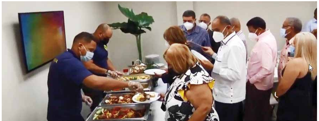
El Almuerzo de Navidad de CONACOOOP se convirtió en un encuentro de familia.

El Consejo Nacional de Cooperativas felicita a cada uno de las y los cooperativistas que, con persistencia, perseverancia y esperanza, han trabajado por durante el año que termina, en la construcción de comunidades que cuenten con el apoyo de sus cooperativas en las necesidades y urgencia, en productos y servicios oportunos y de calidad.