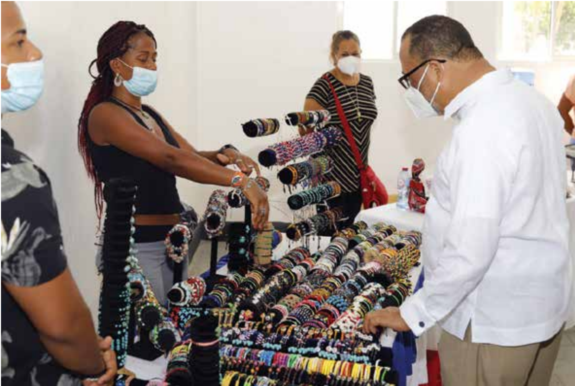
El presidente administrador del IDECOOP observa los productos artesanales en La Romana