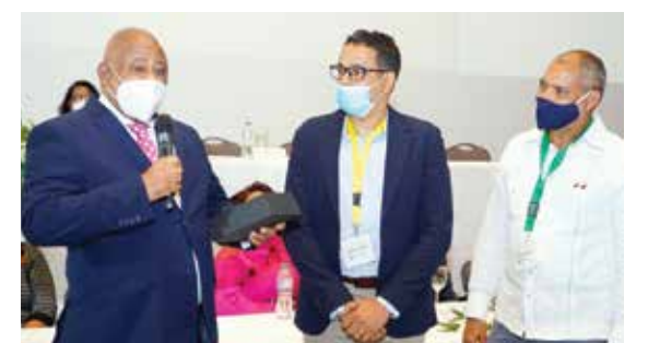
El evento institucional mas importante del Consejo Nacional de Cooperativas resultó en un acontecimiento estelar para cerrar el 2021