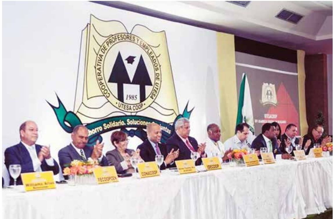
Utesacoop representa una vanguardia del cooperativismo del Cibao.