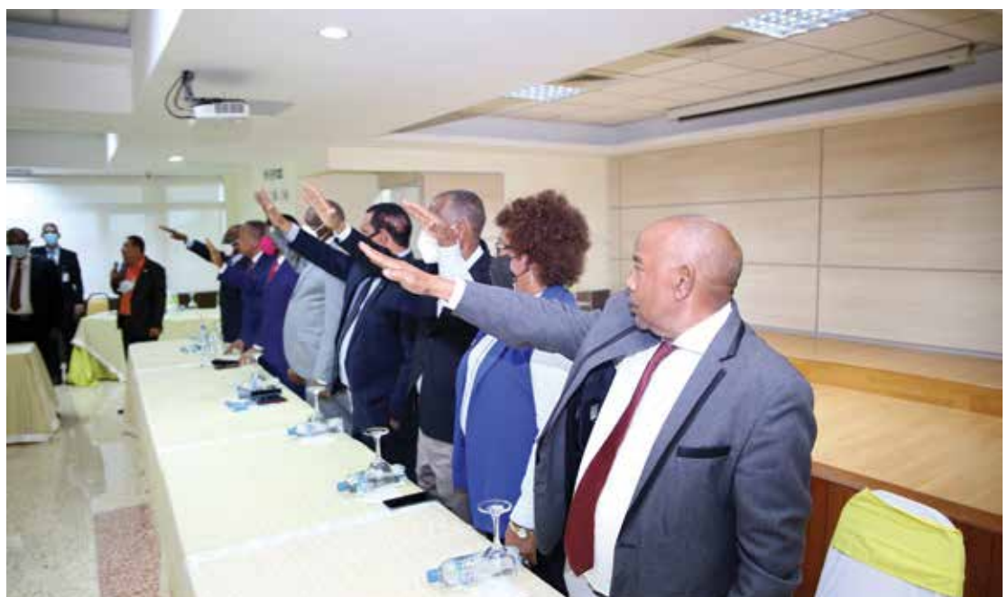
La juramentación de los nuevos consejos de Administración, Vigilancia y Crédito en la Asamblea General Ordinaria de COOPNAMA.