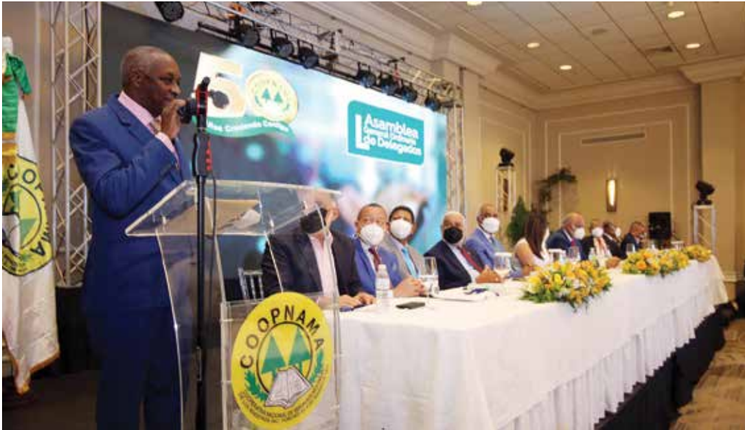
La asamblea de COOPNAMA ratifica el proceso democrático y las orientaciones que ha trazado su actual directiva.

La escogencia se realizó en la Quincuagésima Asamblea General Ordinaria de Delegados.