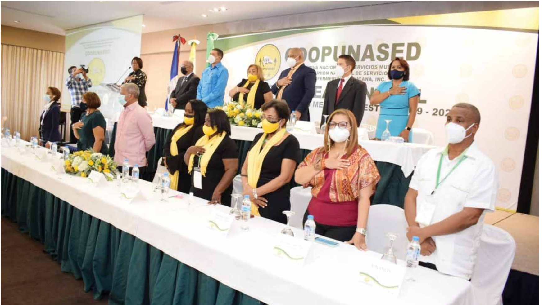
La presidenta de COOPUNASED felicitó a las socias y socios por su apoyo al Consejo de Administración.