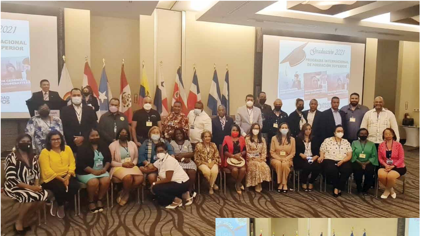
La delegación dominicana que acudió a la Conferencia Internacional TELESCOOP 2030, de la Confederación de Cooperativas del Caribe, Centro y Sur América.

Acudieron a Panamá 240 delegados de Costa Rica, Guatemala, Curazao, Belice, Honduras, El Salvador, Nicaragua y Panamá; y, Cuba, Haití, R. D. y Puerto Rico, Colombia, Perú, Argentina.