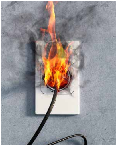
Prevenir incendios en la casa, en el bosque y en los vehículos es una responsabilidad de cada usuarios de esos espacios.