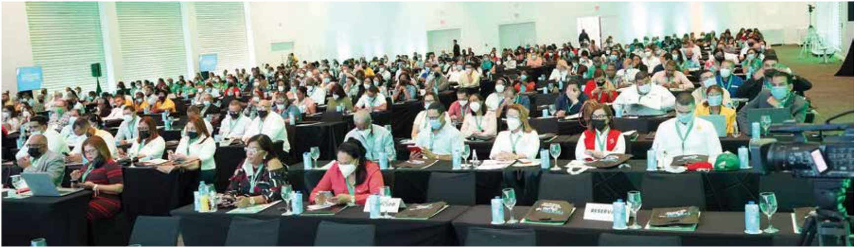
Los delegados aprueban las conclusiones de la IX Convención Financiera del Cooperativismo Dominicano y VI Internacional.

Las conclusiones de la IX Convención Financiera piden aprobación de un código legal cooperativo que tiene 214 millones de pesos en activos, el 22 % del sistema financiero.