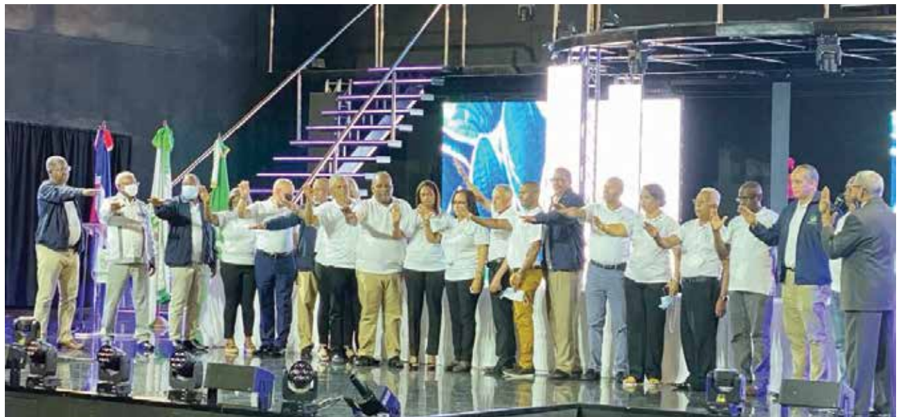
Un aspecto de la mesa principal cuando los directivos proclamaron el orgullo de pertenecer a la cooperativa de profesionales agropecuarios.

“El trabajo ha sido arduo, y sus resultados son evidentes. El futuro cada vez nos traerá más retos y la manera de cómo enfrentarlos es posible integrándonos y aportando ideas, para que COOPNAPA siga creciendo e impactando de manera positiva a nuestros asociados que son nuestra razón de ser y al mismo tiempo ser un ejemplo de gestión