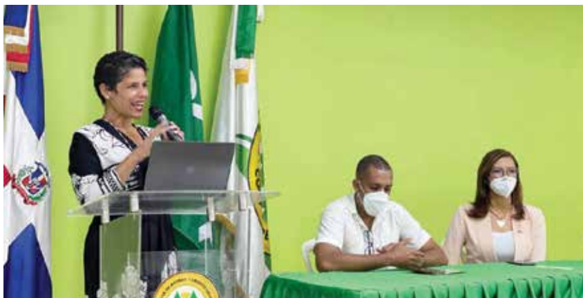
Los tres expositores del conversatorio Buenos Negocios 4.0 en COOPHERRERA.

Buenos Negocios, es un espacio dirigido a los emprendedores y a las PYMES, que inicio en el año 2003.■