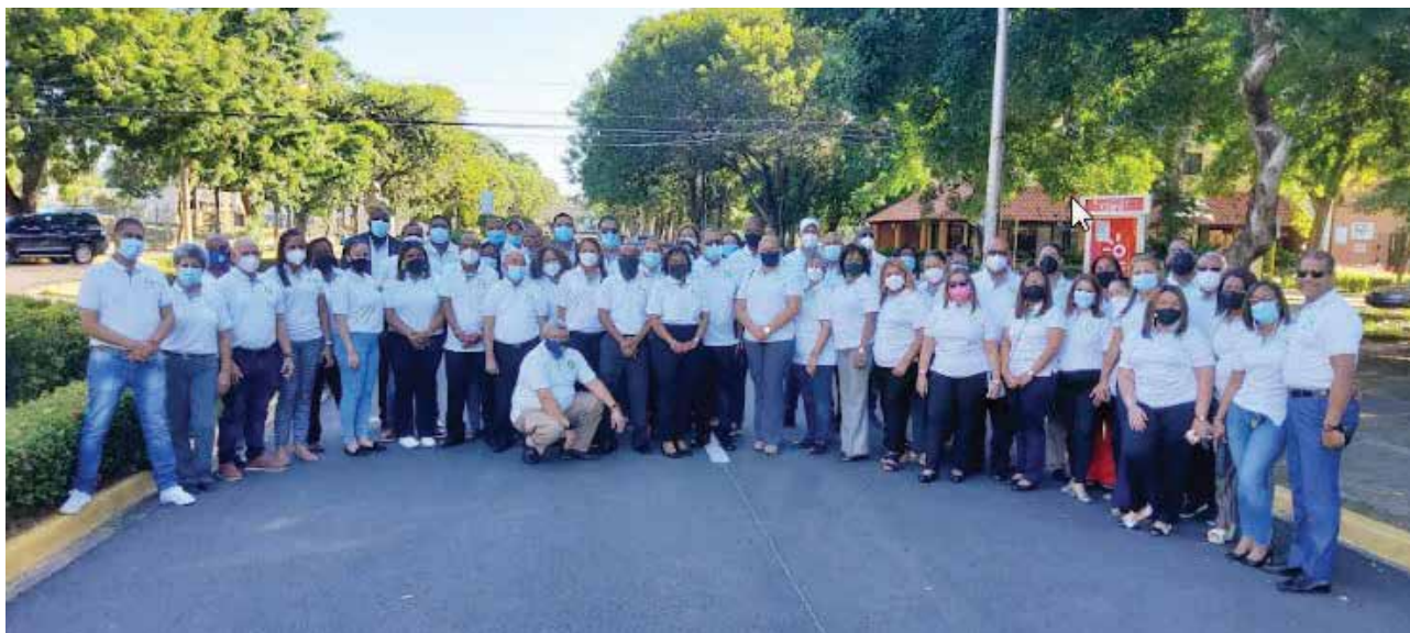
Los directivos de COOEPROUASD en pose oficial en el campus de la UASD.