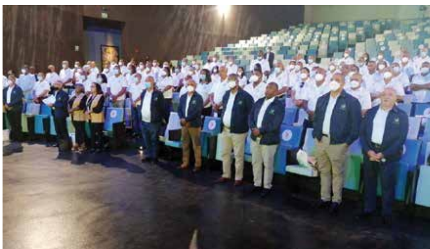
La Asamblea General Ordinaria de COOPNAPA, fue el gran evento institucional en que se presentó la memoria de la gestión 2020.

mejor, la solidaridad. Desde CONACCOOP le animamos a que siga adelante en la misma dirección de perfección solidaria, de cooperación hacia el bien común, en plenitud de amor y templanza ética en el acto cooperativo”.