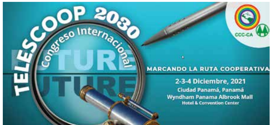
Cartel que motiva a participar en la Conferencia Telecoop 2021, de la Confederación de Cooperativas del Caribe, Centro y Sur América

Objetivos: Analizar las principales megatendencias y su impacto en las organizaciones cooperativas; Identificar las principales contribuciones del cooperativismo a la sociedad y realizar un análisis prospectivo sobre el rol del cooperativismo al 2030.