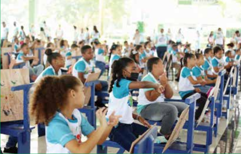
Niños y niñas participaron del COOPINTA convocado por COOPMAIMON.

Se hizo el anuncio en la sesión final del concurso de pintura infantil. Se reconoció a la Escuela de Arte Cándido Bidó.