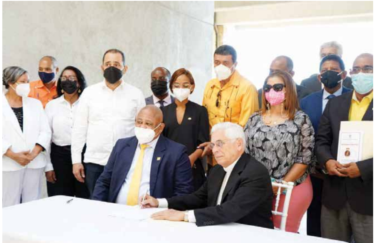
Foto oficial de la firma del convenio con la Conferencia del Episcopado y CONACOOOP para participar en el programa de celebración del centenario de la Coronación de la Virgen de Altagracia.

También, se busca un reencuentro entre el cooperativismo dominicano, que tiene fuertes raíces cristianas, con la