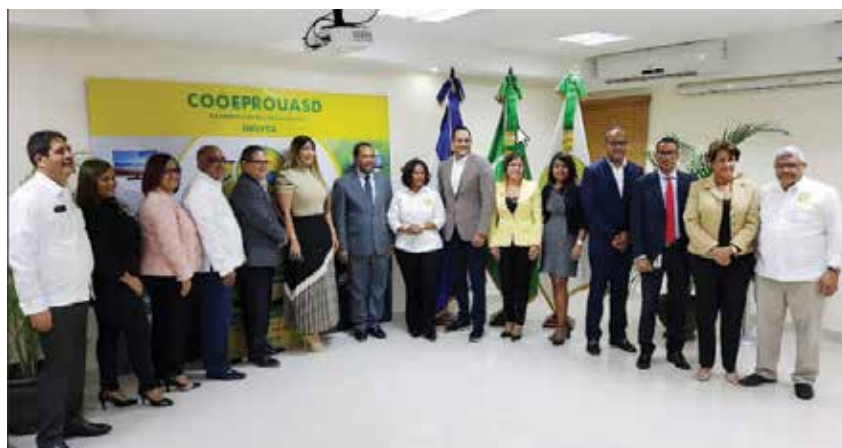
La presidenta Yudelka Báez Gómez junto a algunos de los invitados.