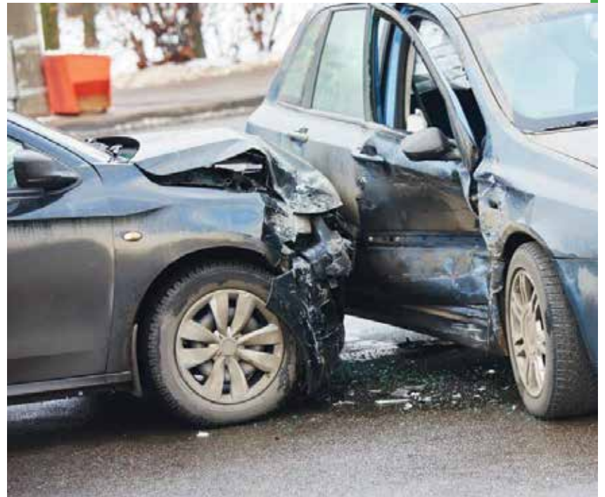
Los accidentes de tránsito son la segunda causa de muerte, luego de los problemas cardíacos y circunstancialmente el Covid 19.

En las Américas, ha habido algunas mejoras con respecto a la gestión institucional: al menos 29 de los 35 países tienen una agencia líder en temas de seguridad vial, 23 países tienen estrategias de seguridad vial, 23 países tienen estrategias que están financiadas y 18 tienen estrategias con un objetivo de reducción de fatalidades.