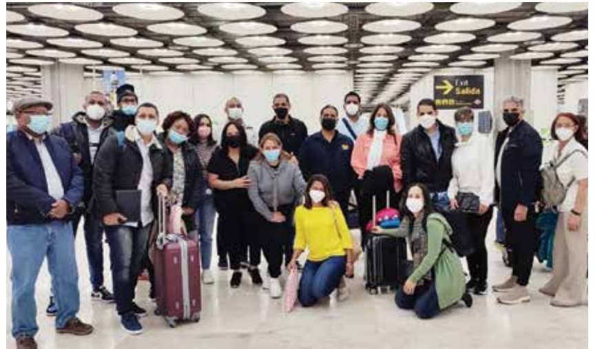
La delegación de los pasantes cooperativistas al llegar a Madrid para trasladarse a la Escuela de Economía Social de Andalucía.

El Instituto de Formación Cooperativa es el organismo docente del Consejo Nacional de Cooperativas para impulsar el sector cooperativo mediante la capacitación, formación y actualización de sus integrantes, concebido como un patrimonio institucional del sector cooperativo