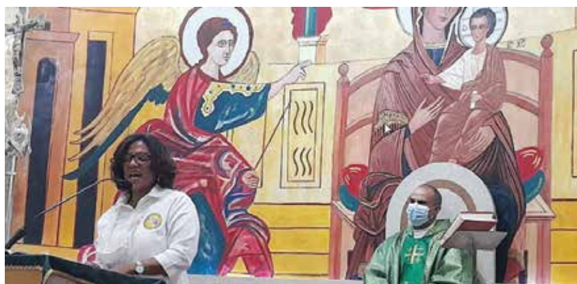
La misa de acción de gracias por el aniversario 44 de COOEPROUASD fue un evento religioso de gran significación.

COOE-PROUASD se ha convertido en la empresa de los universitarios, pues ha ido de la mano de los emprendedores y del progreso de todos sus asociados que se han planificado para resolver los problemas de adquisición de viviendas y medios de transporte.